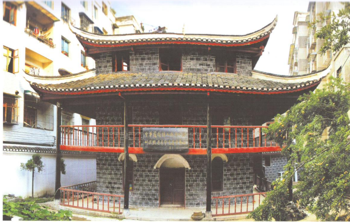
中华苏维埃人民共和国川滇黔省革命委员会大定（今大方）旧址